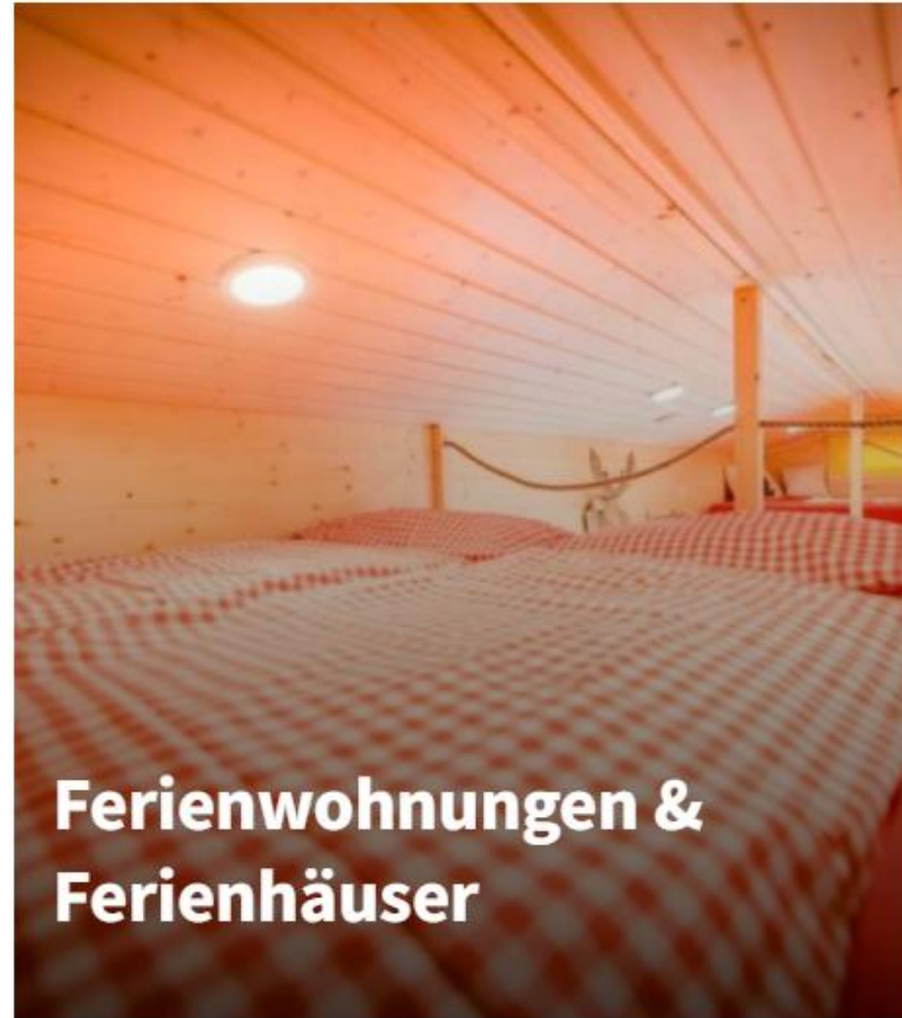
Ferienwohnungen & Ferienhäuser

Plus d'informations sur : Hébergement à Pfullendorf et dans les environs