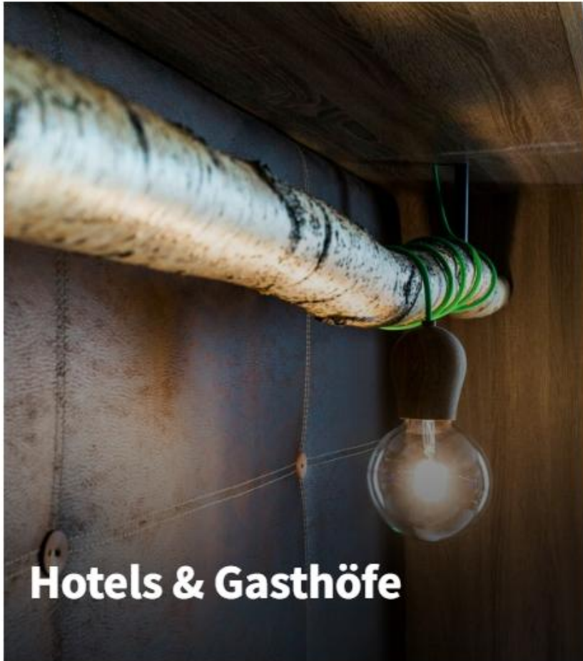
Hotels & Gasthöfe